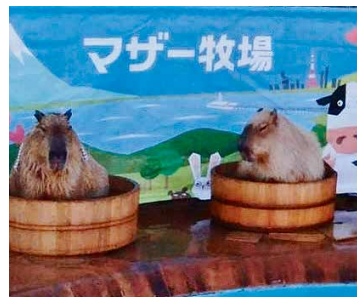
お風呂に入るカピバラ