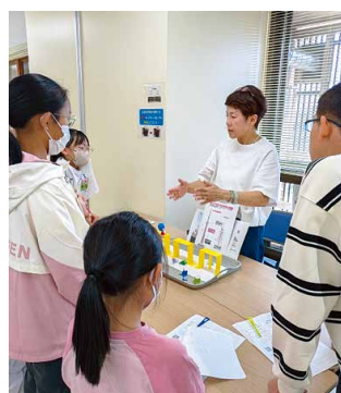
3つの耐震構造の上で紙相撲