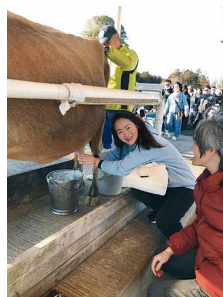
ドキドキの乳搾り体験

帰りも大渋滞。運転手さんの気転で途中電車の駅で降ろしてもらう人もいましたが、夜8時に無事市役所帰着となりました。バスの中でのアンケートでは、渋滞時の対応などの指摘もありましたが、楽しかった点として、「初めてのところに行けた」「他の人と交流できた」「アクティビティーが楽しかった」「また行きたい」などの感想が多数ありました。「協会の会員になりたい」「またイベントの手伝いをしたい」など心強い感想もいただきました。