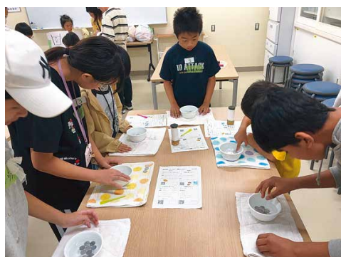
一円玉を浮かべて表面張力実験

教室から9名、対面教室から14名、合計23名が、地域の小学生17名と一緒に様々な実験を楽しみました。用意した実験は、「空気鉄砲」「万華鏡作り」「耐震構造比較」「磁石で宝探し」「一円玉の表面張力」の5つ。日本人と外国人の子どもたちが一緒に実験をしながら、ワークシートに予想と結果を書いて、スタンプをもらうというものです。言葉がわからなくても実験をし、楽しく活動の場を共有するという良い経験になったようです。