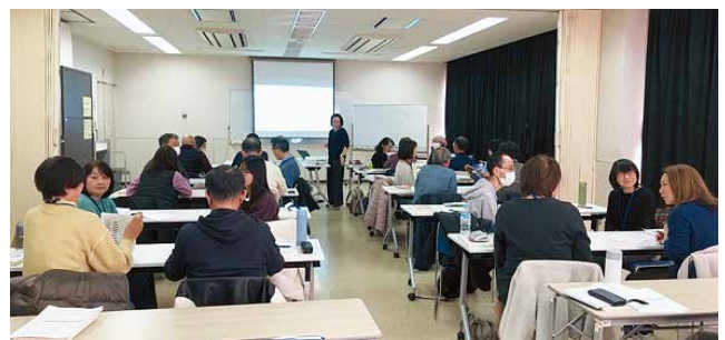
養成講座でのグループ活動