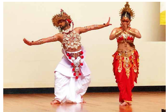
ウィシュワディヌ舞踊団による民族舞踊

最後は、ウィシュワディヌ舞踊団によるスリランカの民族舞踊タイム。華やかな衣装を身にまとい、スリランカ語の曲をバックに、賑やかな踊りが繰り広げられました。