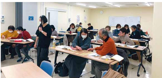
フォローアップ講座のワークショップの様子

また、今年度も1月から3月まで養成講座を行い、29名の受講生が令和8年度から活動する予定です。多様な生活環境を持つ人たちがボランティアをしていますので、家庭や個人のご事情により活動を続けられない人も多く、ボランティアの補充は毎年の課題です。皆さんも、ぜひ外国人住民に寄り添って、日本語を覚えていただく支援者になってみませんか。日本語ひろばのボランティアは、養成講座受講などの条件はありません。ホームページからお問い合わせください。