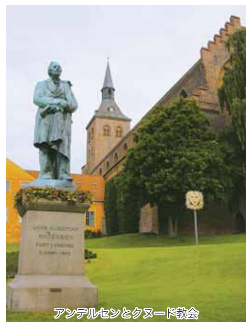
アンデルセンとクヌード教会