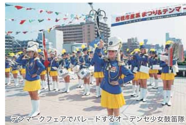
デンマークフェアでパレードするオーデンセ少女鼓笛隊

10月 千葉県高齢者福祉施設協議会代表団が訪問。 アンカー・ボイエ市長一行が来船し、アンデルセン公園起工式等に出席。オーデンセ市から講師を招致して福祉フォーラム「フューチャー・ワークショップ」を開催。