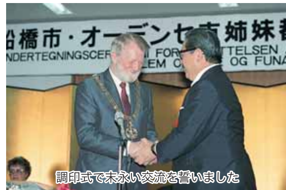
調印式で永い交流を誓いました

1989 平成元年 4月6日 オーデンセ市長一行を迎え姉妹都市提携調印。 この提携で教育・文化・スポーツ・青少年・産業等の幅広い交流を約す。 10月 船橋市議会が「船橋市・オーデンセ市友好親善代表団」を派遣。 「船橋市海外教育事情視察団」を派遣。