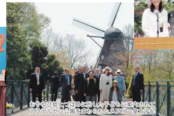
おやゆび姫とつばめに扮した子どもに案内されてアンデルセン公園をまわられたメアリー皇太子妃