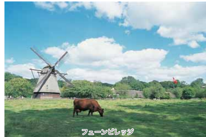
フューンビレッジ