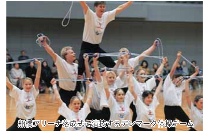
船橋アリーナ落成式で演技するデンマーク体操チーム

1994 平成6年 1月 総合体育館の落成式のため、「デンマーク体操チーム」が来船。 3月 千葉県社会体育公認指導員船橋市連絡協議会のスポーツ交流視察団が訪問。 5月 ケア・リハビリセンター建設のため福祉視察団を派遣。 6月 アンデルセン公園建設のため職員を派遣。 8月 姉妹都市提携5周年を記念して船橋ジュニアオーケストラを派遣。