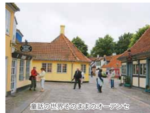
童話の世界そのままのオーデンセ