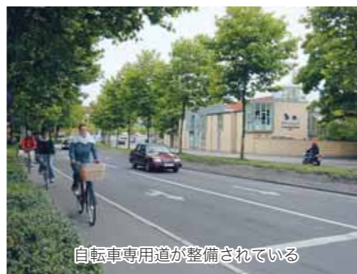
自転車専用道が整備されている

古くは、教会が支配する都市として、中世には地の利を生かした商業都市として、18世紀以降は港や運河を利用した商業港湾都市として発展し、現在は酪農や花・野菜の温室栽培、造船業・鉄鋼業・家具製造業や食品産業などが盛んな近代都市として繁栄しています。また、国立南デンマーク大学を始め、各種の学校や文化施設、福祉施設の充実した都市でもあります。