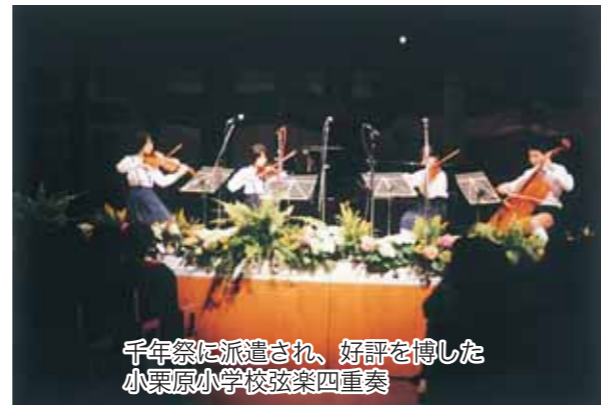
千年祭に派遣され、好評を博した小栗原小学校弦楽四重奏

10月 千葉県高齢者福祉施設協議会代表団が訪問。 アンカー・ボイエ市長一行が来船し、アンデルセン公園起工式等に出席。オーデンセ市から講師を招致して福祉フォーラム「フューチャー・ワークショップ」を開催。