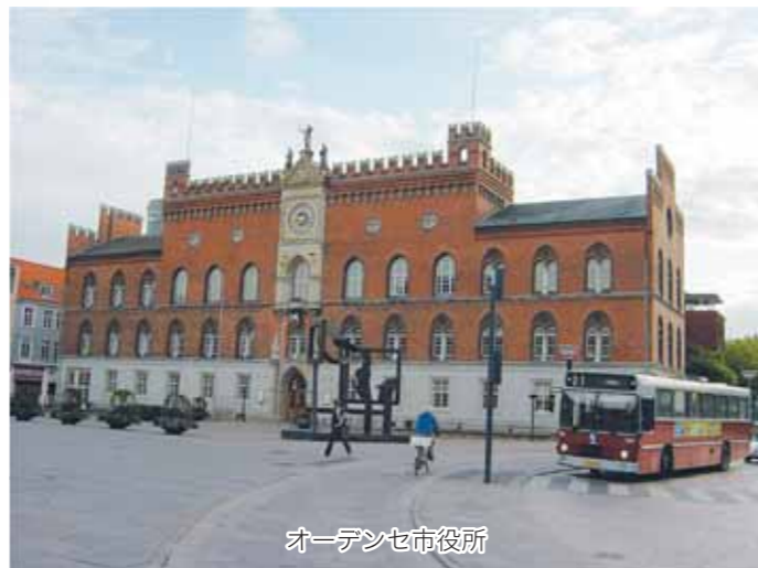
オーデンセ市役所

(2) 提携の経緯 1984(昭和59)年、オーデンセ市長が自治体コンピュータ高度利用視察団の一員として来船したことを契機に、船橋市の先進技術とオーデンセ市の童話の心が取り持つ縁で交流が始まりました。1986(昭和61)年には友好親善使節団、教育使節団を派遣し、1988(昭和63)年には、オーデンセ市千年祭記念式典に招待され友好親善使節団を派遣するとともに、オーデンセ市国際親善サッカー大会に市立船橋高校サッカー部が参加、翌1989(平成元)年にオーデンセ市代表団を迎えて姉妹都市提携の調印をしました。