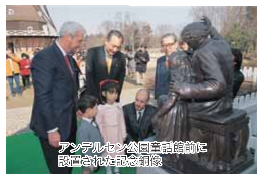
アンデルセン公園童話館前に設置された記念銅像