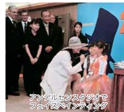
アンデルセンスタジオでフェイスペインティング