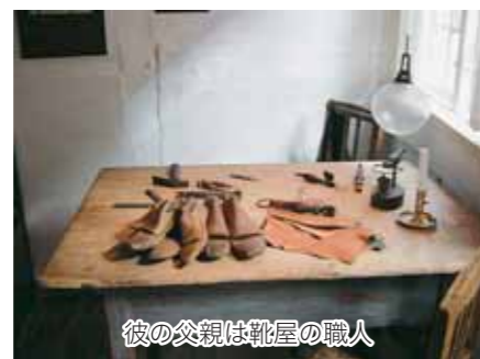
彼の父親は靴屋の職人