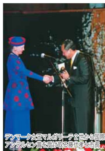
デンマーク女王マルガリーテ2世から国際アンデルセン賞を受取る藤代孝七市長

文化親善使節団の皆さんによる、書道、華道のほか太巻きすしづくりの体験もありました