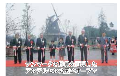
デンマークの風景を再現したアンデルセン公園がオープン

1995 平成7年 1月 アンデルセン公園建設の設計協議のため、関係者が来船。 8月 船橋市私立幼稚園職員海外事情視察団が訪問。 10月 「船橋市海外文化・スポーツ事情視察団」及び「船橋市海外教育事情視察団」を派遣。 北総育成園がオーデンセ市において演劇公演を行った。