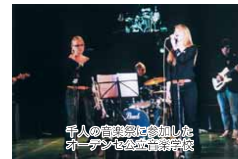
千人の音楽祭に参加したオーデンセ公立音楽学校