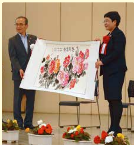
ステージでの式典

西安の子ども、船橋の子どもと一緒に踊りを楽しみ、賑やかで微笑ましい交流が繰り広げられました。