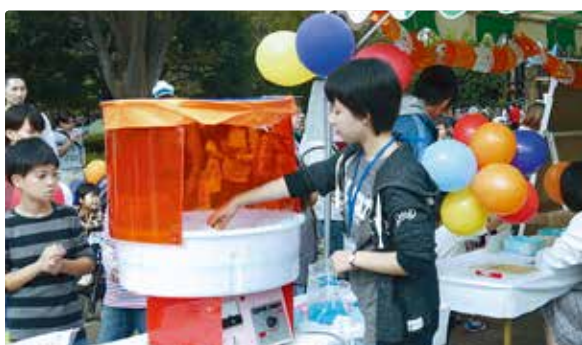
ハイワード市派遣研修生の綿菓子