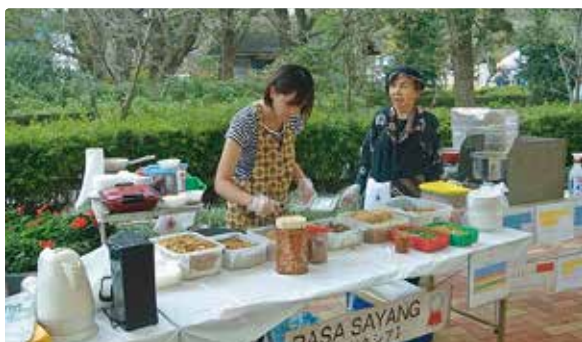
インドネシア料理