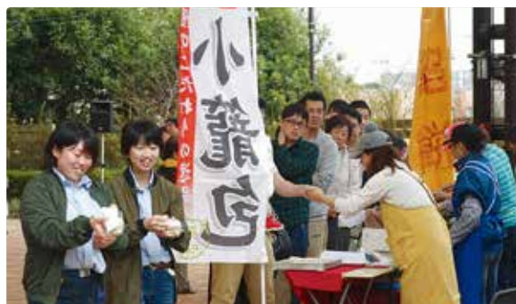
中国のショウロンボウ